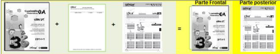
Gráfico 6: Ensamble de paquetes